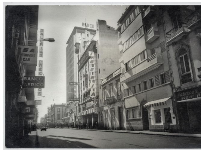
Calle Fernando León y Castillo en la década de 1960. ES 35001 AMC-AT-336

representación del rey de España, el Acuerdo Internacional para la Supresión de la Trata de Blancas en 1904.